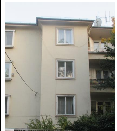
A homlokzaton megjelenő kábelek, egyéb berendezések, illetve a tetőn látható antennák