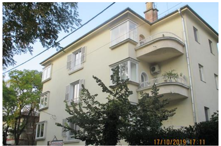
Szilágyi Erzsébet fasor felőli homlokzat