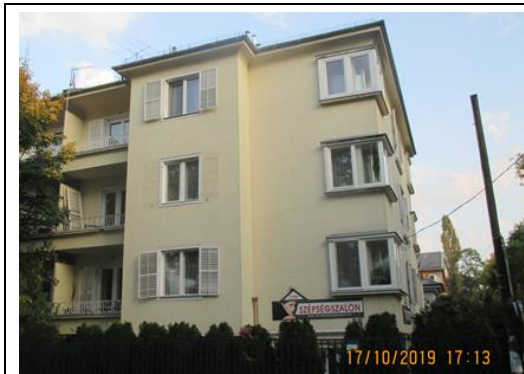
Gábor Áron utca 1a homlokzata