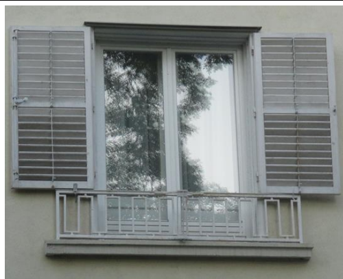
A homlokzaton több helyen is megjelenő franciaerkély és fa zsalugáterek