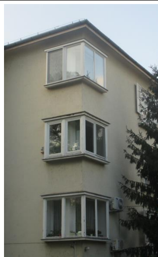
Az épület sarkain látható virágablakok