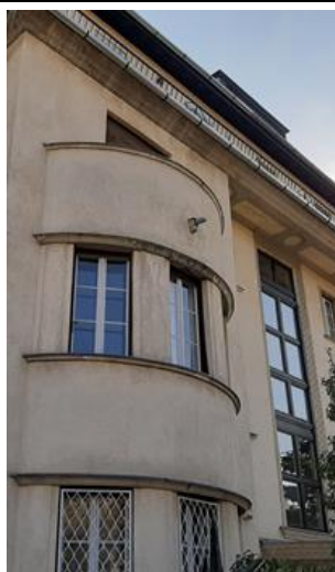
A két szint magasan kidomborodó zárterkély