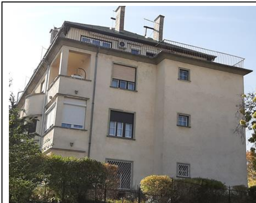
A Vérhalom utca felőli homlokzat és a beüvegezett