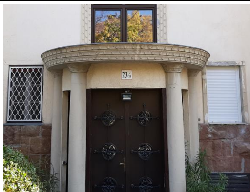
A díszes főbejárat