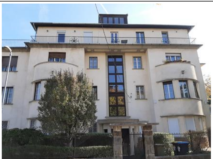
A Szemlőhegy u. felőli homlokzat