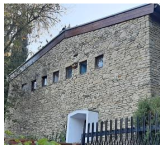
A díszítés nélküli homlokzat és a négyzetes ablaksor