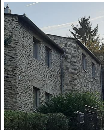
Az egymástól eltolt épülettömegek, csatlakozása