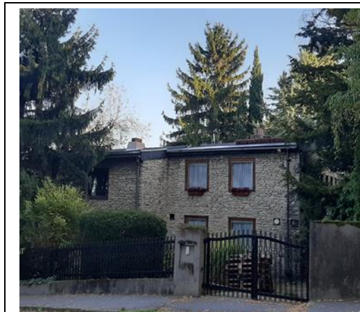
Zsemlye utca 6 homlokzata