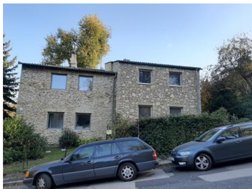
A nem teljesen azonos homlokzati kialakítás szembetűnő