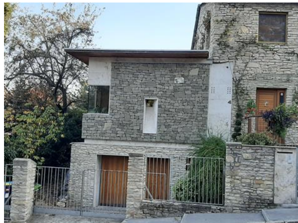
A Zsemlye utca 4 bővítése