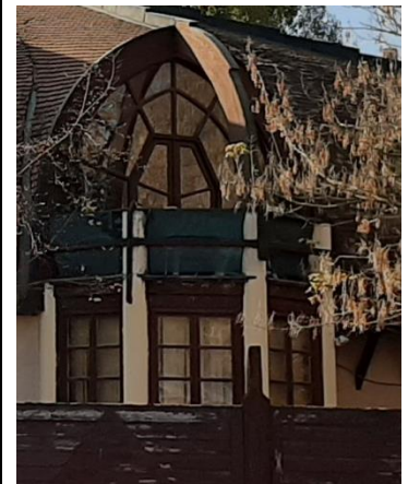
Az erkély és a homlokzaton megjelenő nagyméretű üvegfelületek