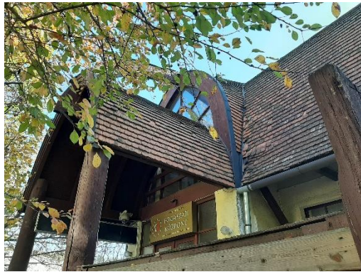
Az íves bejárat fa szerkezet és a tető részlete