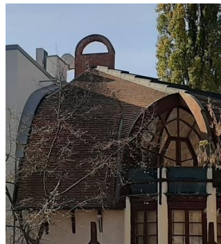
A különleges tető és a hozzá kapcsolódó épülettömeg illeszkedése