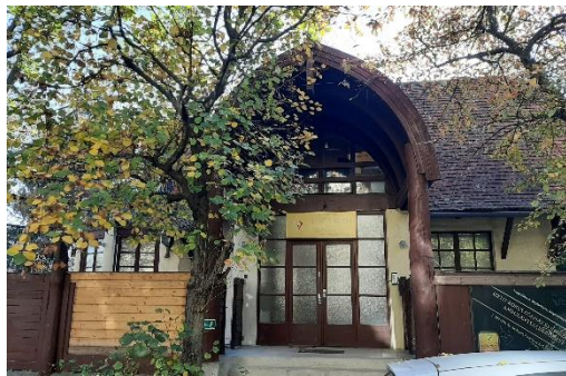
Az épület homlokzata Hargita utca felől