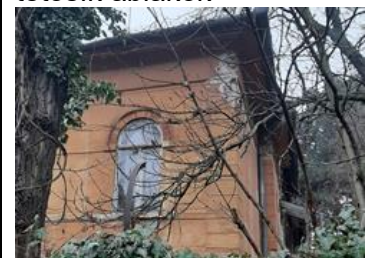
Az íves nyílászáró, a különálló kis épületen