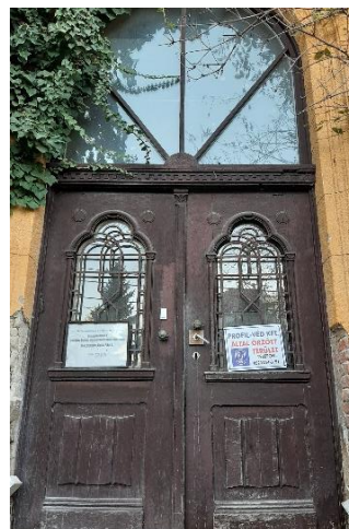
A főépület díszes főbejárata