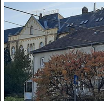
Az épület tetőzete, a tetősík ablakok