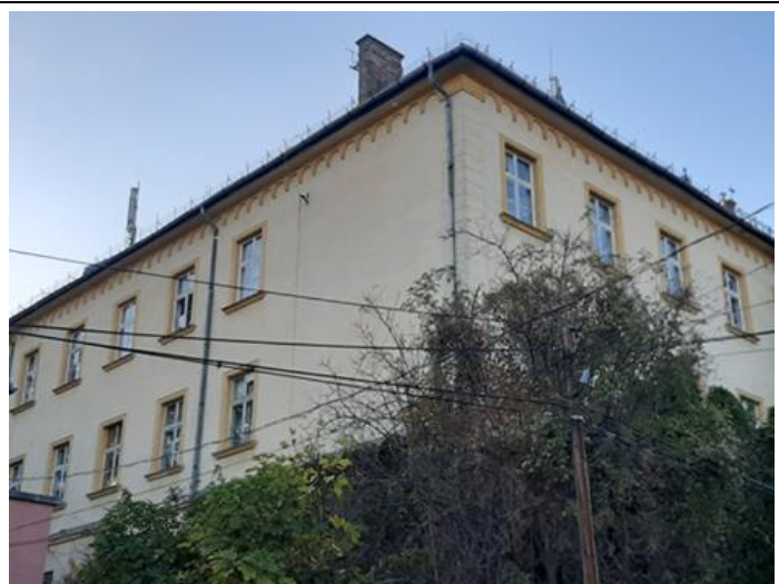
Tárogató út fasor felőli homlokzat