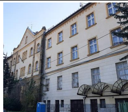
Tárogató út felőli homlokzat