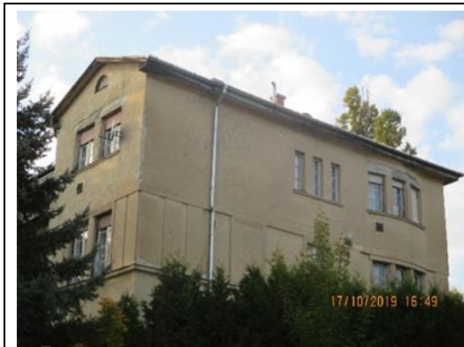
A keleti homlokzat