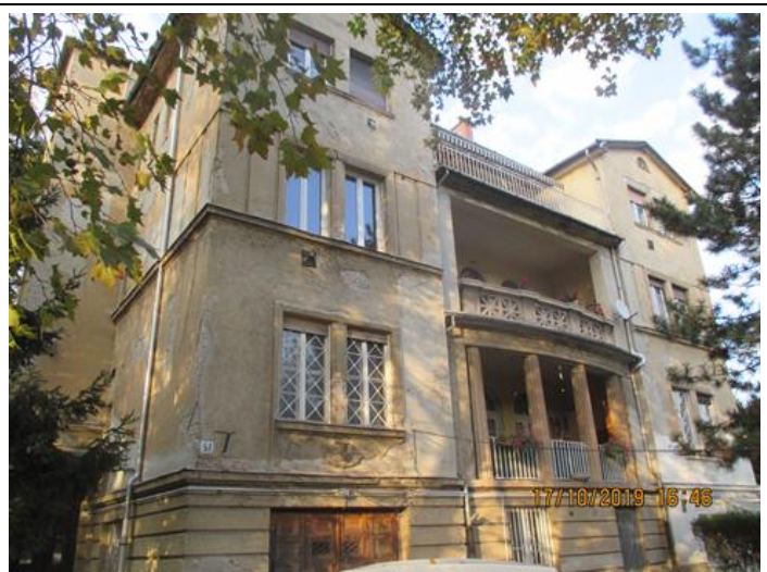
Szilágyi Erzsébet fasor felőli homlokzat