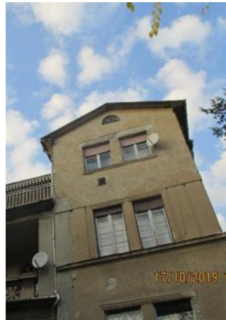
A lizénákkal tagolt oromfalas rizalit