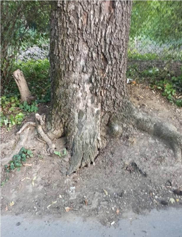
A korhadt gyökérnyak melletti talaj repedés