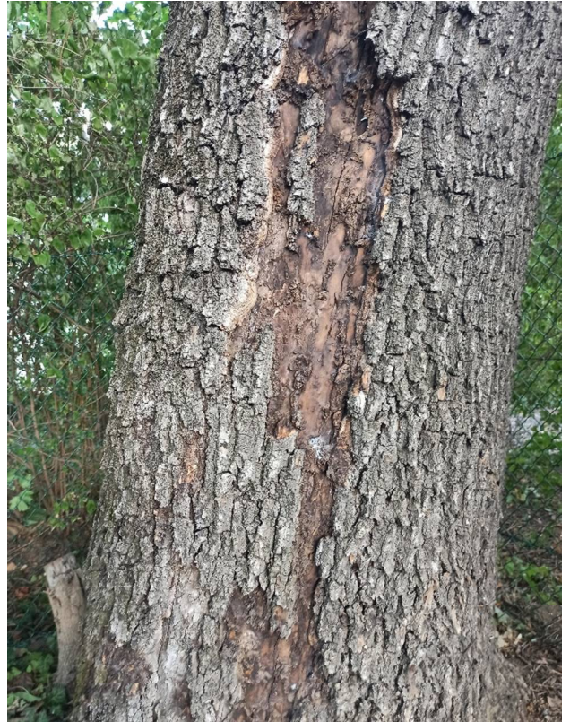
Kiterjedt kéreg elhalás