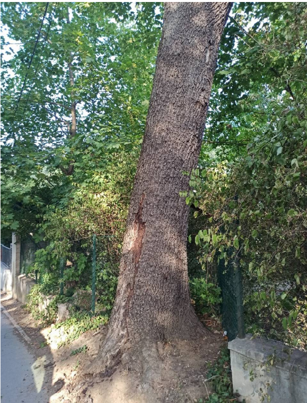
Dőlésnek indult törzs