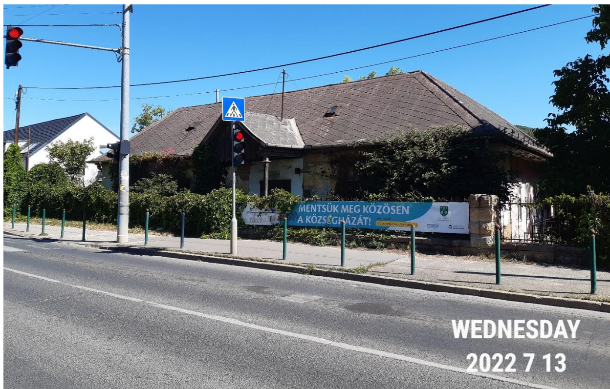
Az épület homlokzata