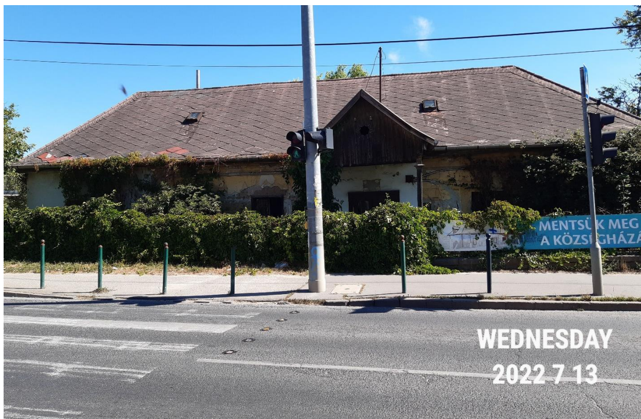
Az épület homlokzata