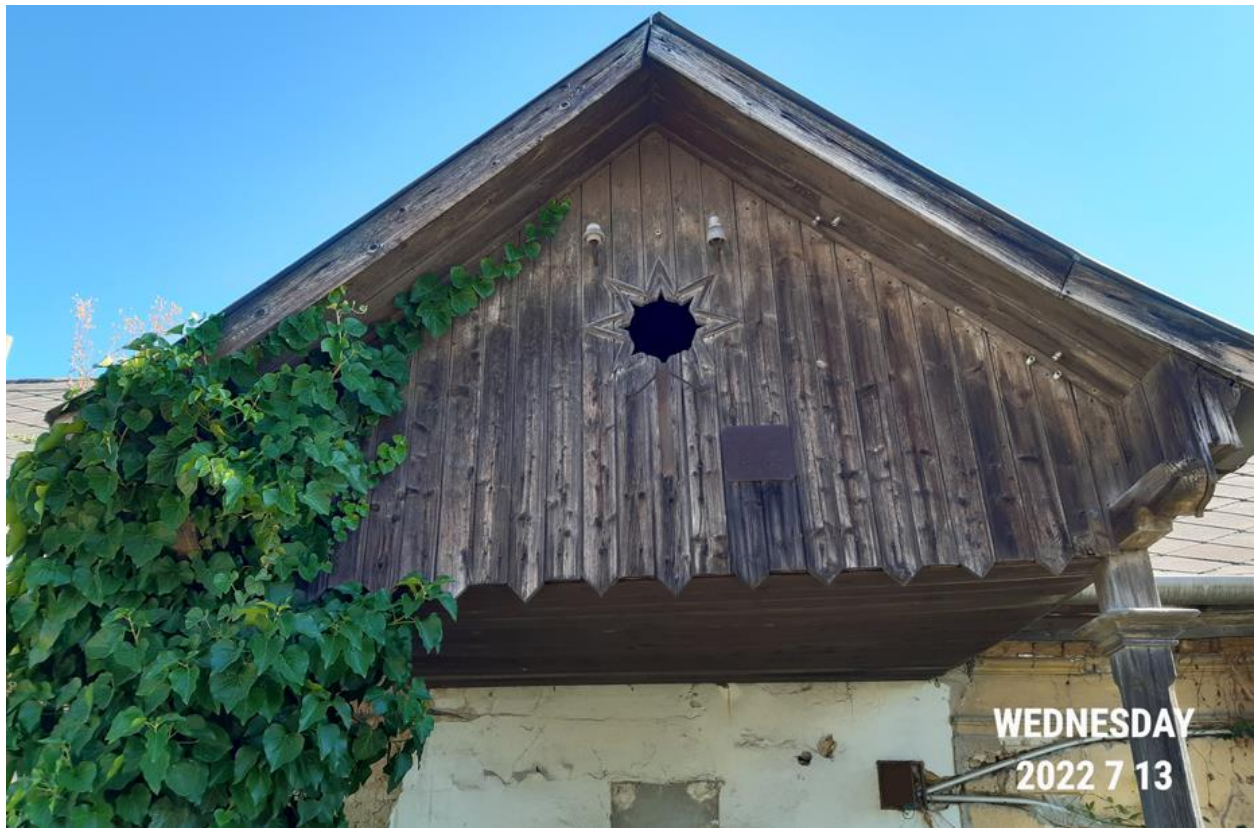
A fa orom és faragott csillag motívum