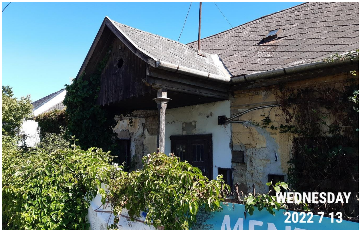
Részlet a homlokzatból