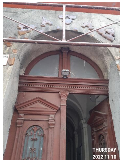
A lépcsőház és a historizáló bejárati ajtó részlete