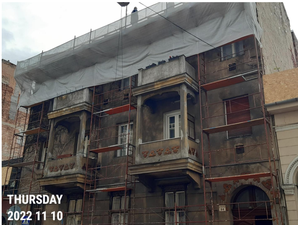
Az emeleteket összekapcsoló erkélypár