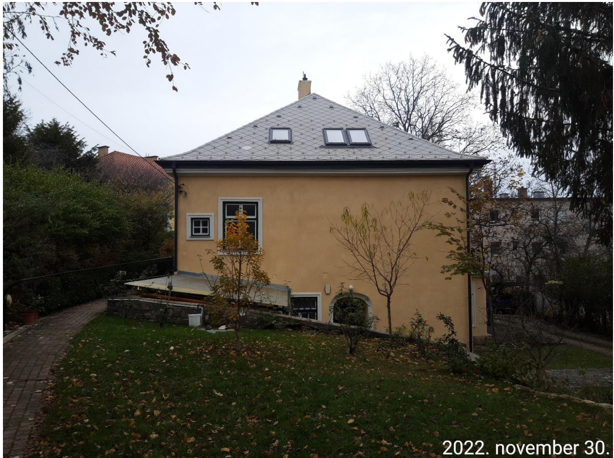
Utca felőli homlokzat