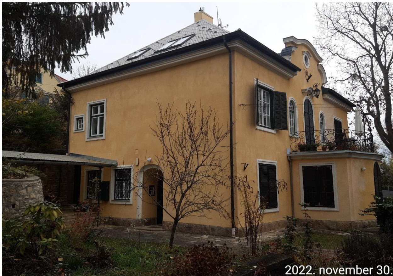
Főhomlokzat és az utcai homlokzat