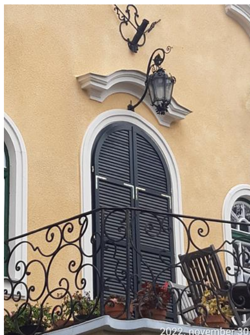
Emeleti ajtó és homlokzati díszek