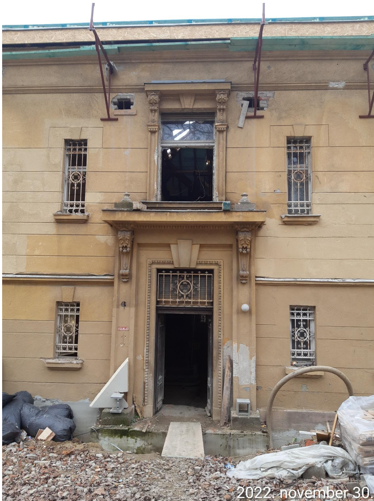
Díszes bejárati ajtó