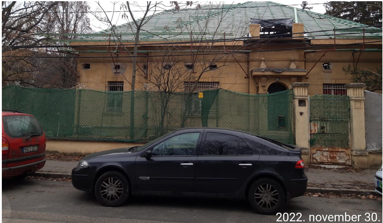
Völgy utcai homlokzat