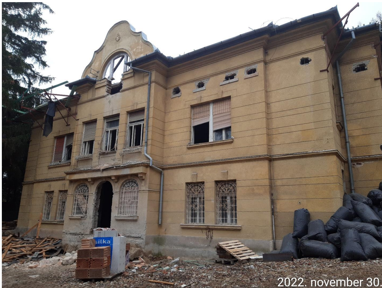
Hátsókert felőli homlokzata